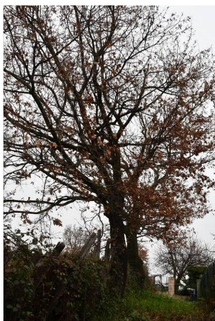
Chêne - La Perrière