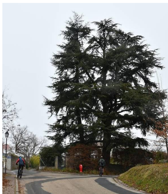
Cèdre - Le Rampeaux