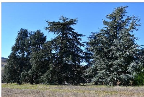
Cedres de l'Atlas, du Liban et bleu- Bourg