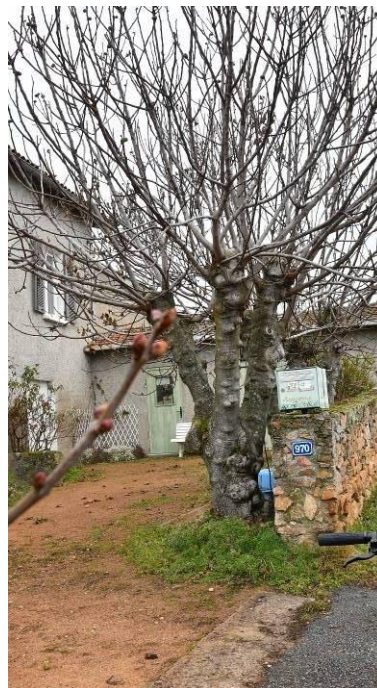
Figuier - Les Arravons