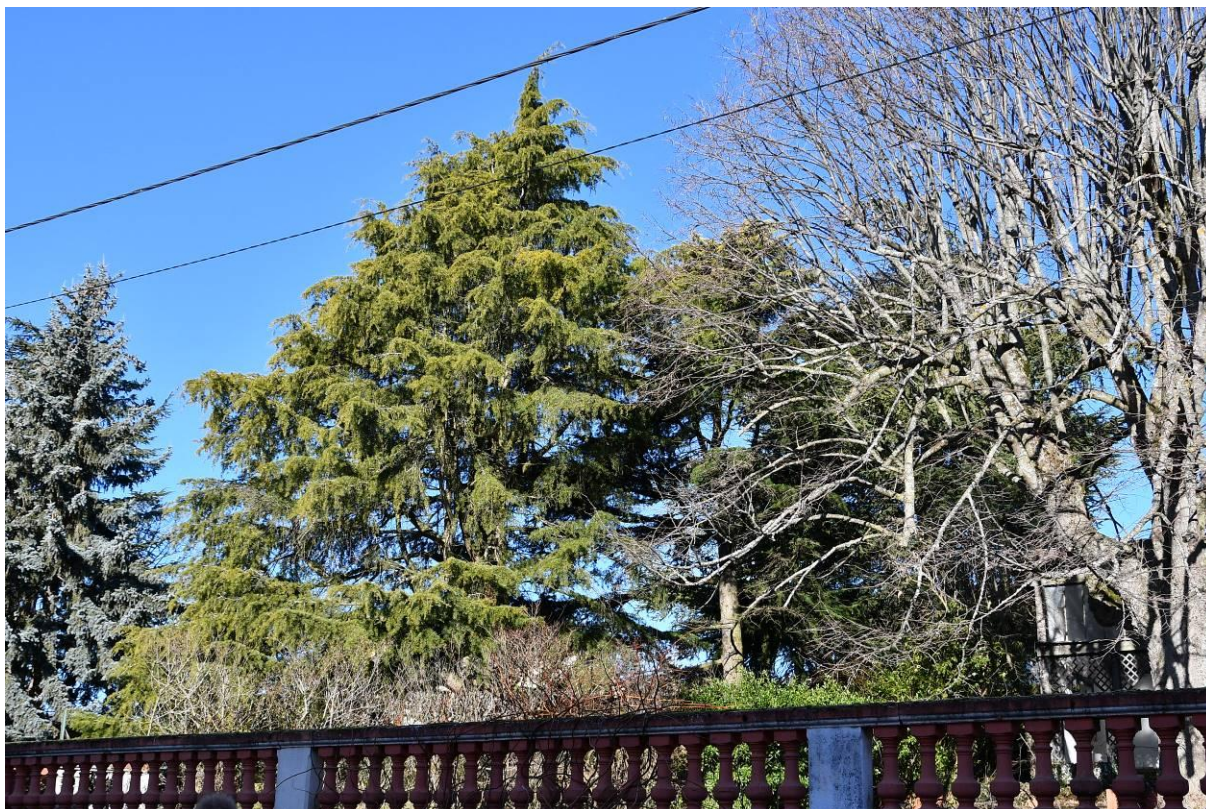
Un cèdre deodara- Route du Barrage