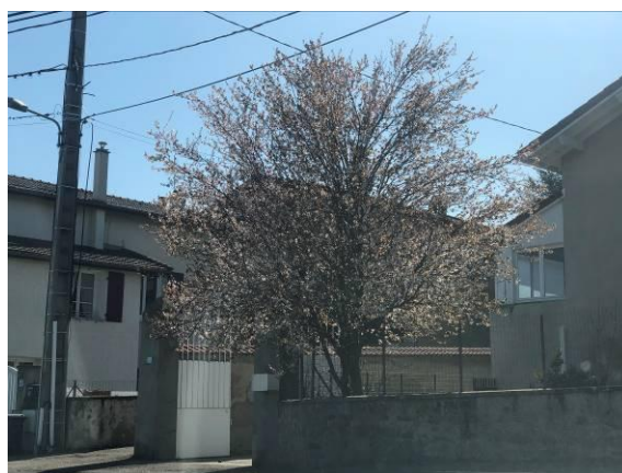
Prunus - Le Plat