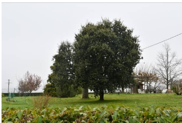
Chêne vert - Les Arravons