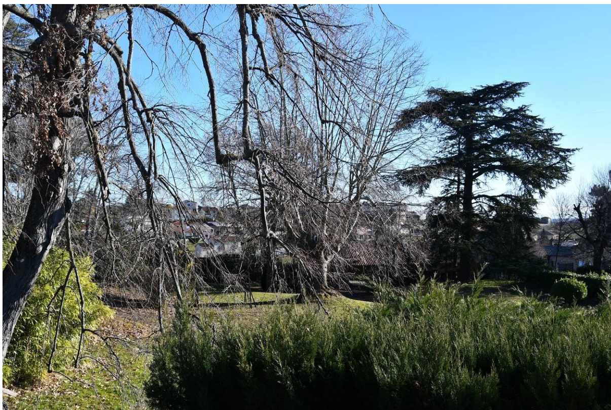
Parc du Château