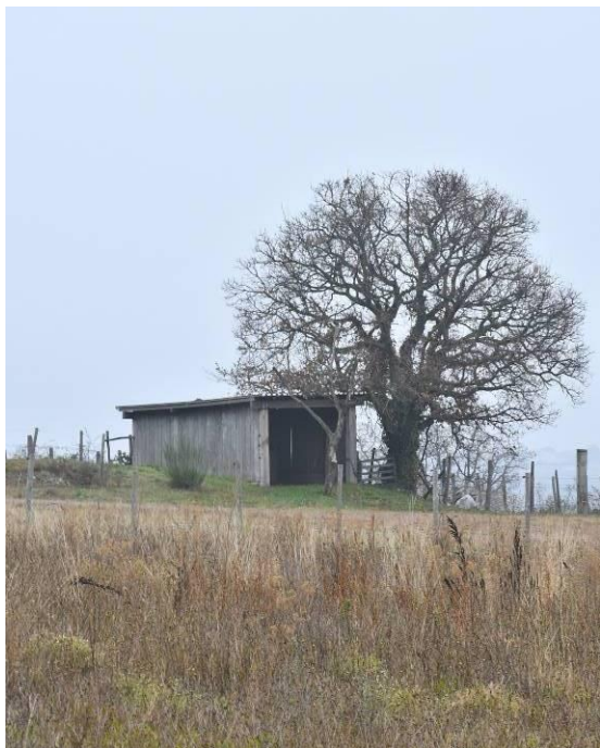
Chêne - Les Arravons