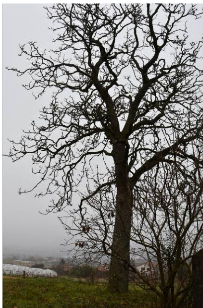
Marronnier - Le Narbonnet