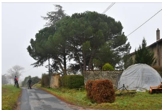
Pin – Le Narbonnet