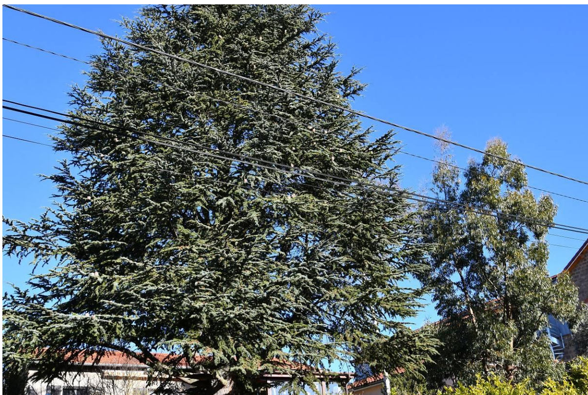
Un cèdre et un Eucalyptus - Route du Barrage