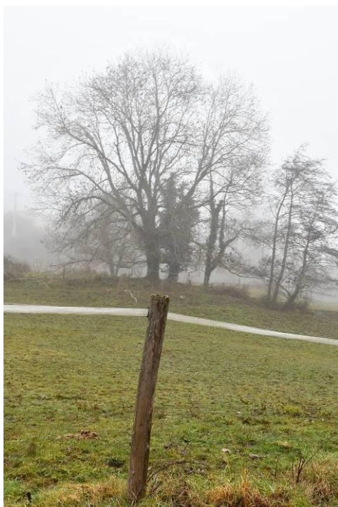
Frêne – Les Grange, Le Brochet