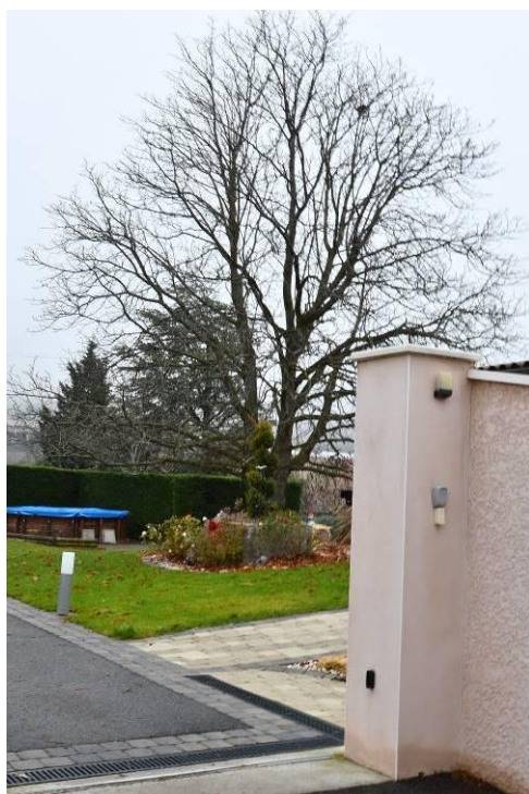
Erable - Le Plat