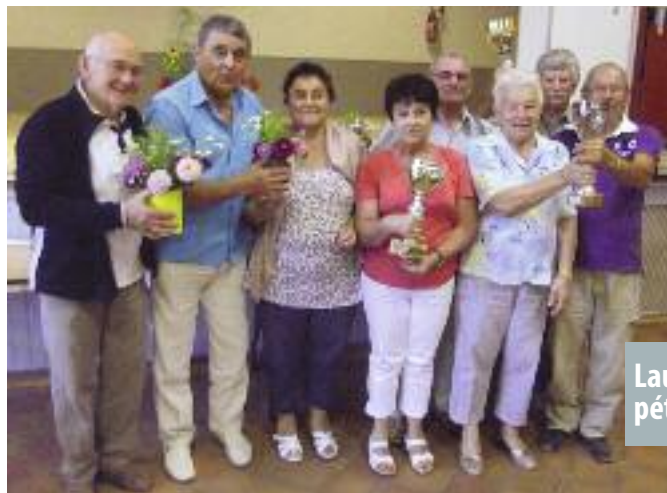
Lauréats du concours de pétanque de la FNACA