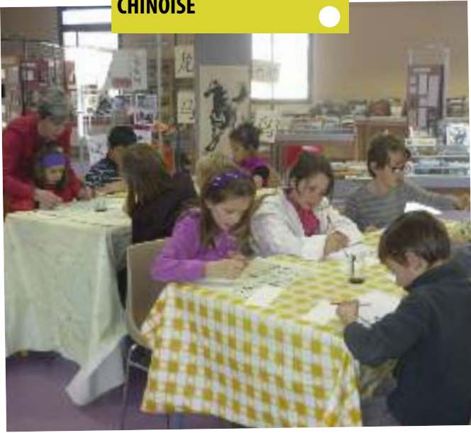
ATELIER DE CALLIGRAPHIE CHINOISE