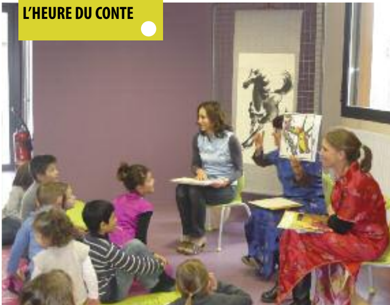
L'HEURE DU CONTE