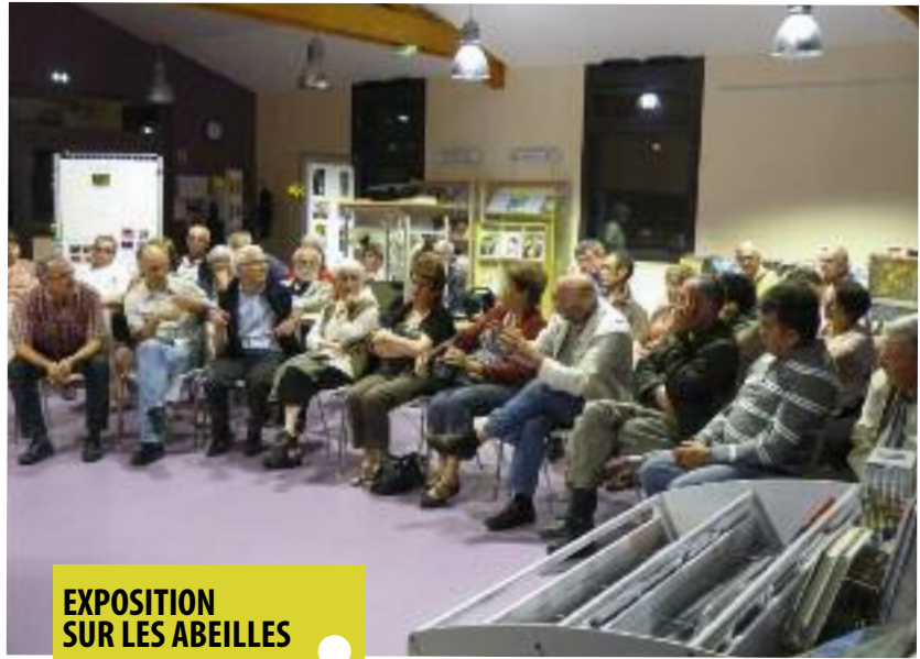
EXPOSITION SUR LES ABEILLES