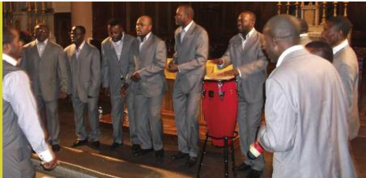
La chorale Parousia

Le public a été particulièrement sensible et ému de l'énergie et de l'enthousiasme que cette chorale a exhalé à travers les chants et les rythmes mélodieux, accompagnés de percussions. ■