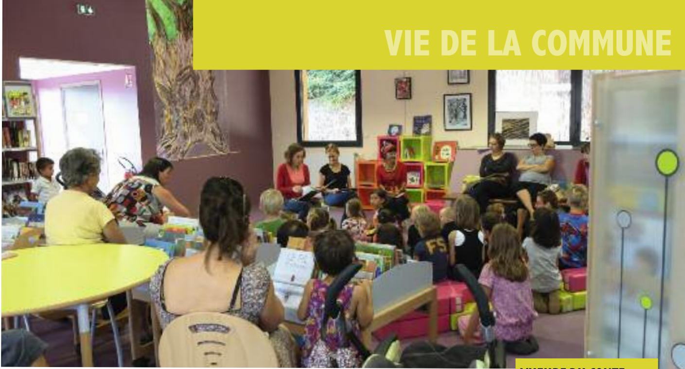
L'HEURE DU CONTE