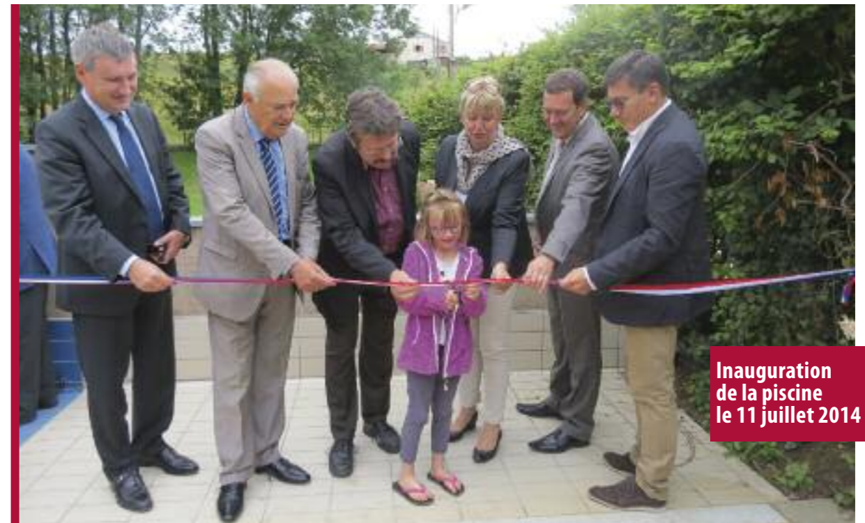
Inauguration de la piscine le 11 juillet 2014

Le non respect de cet arrêté municipal pourra faire l'objet d'une verbalisation. ■